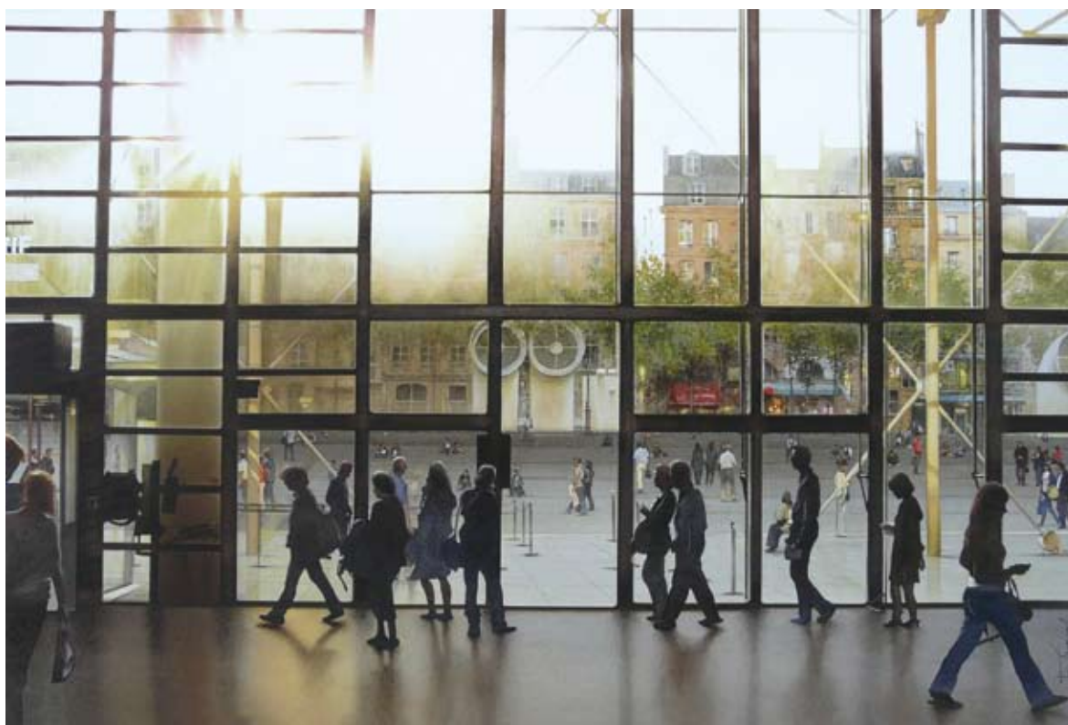
Monde riant Beaubourg, aquarelle, 80 cm x 53 cm, 2011.

“Paris... Plus que la capitale, c'est la lumière le sujet”