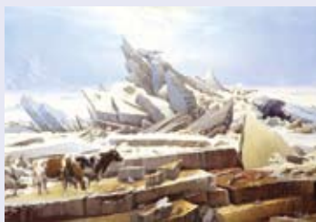
Les vaches perdues sur la mer de glace.

La mer de glace ou l'espoir déçu de Caspar David Friedrich. Ce tableau symbolise toute la poésie romantique du XIX e siècle. La nature y est omniprésente, face à l'homme mortel. Je lui ai d'ailleurs rendu