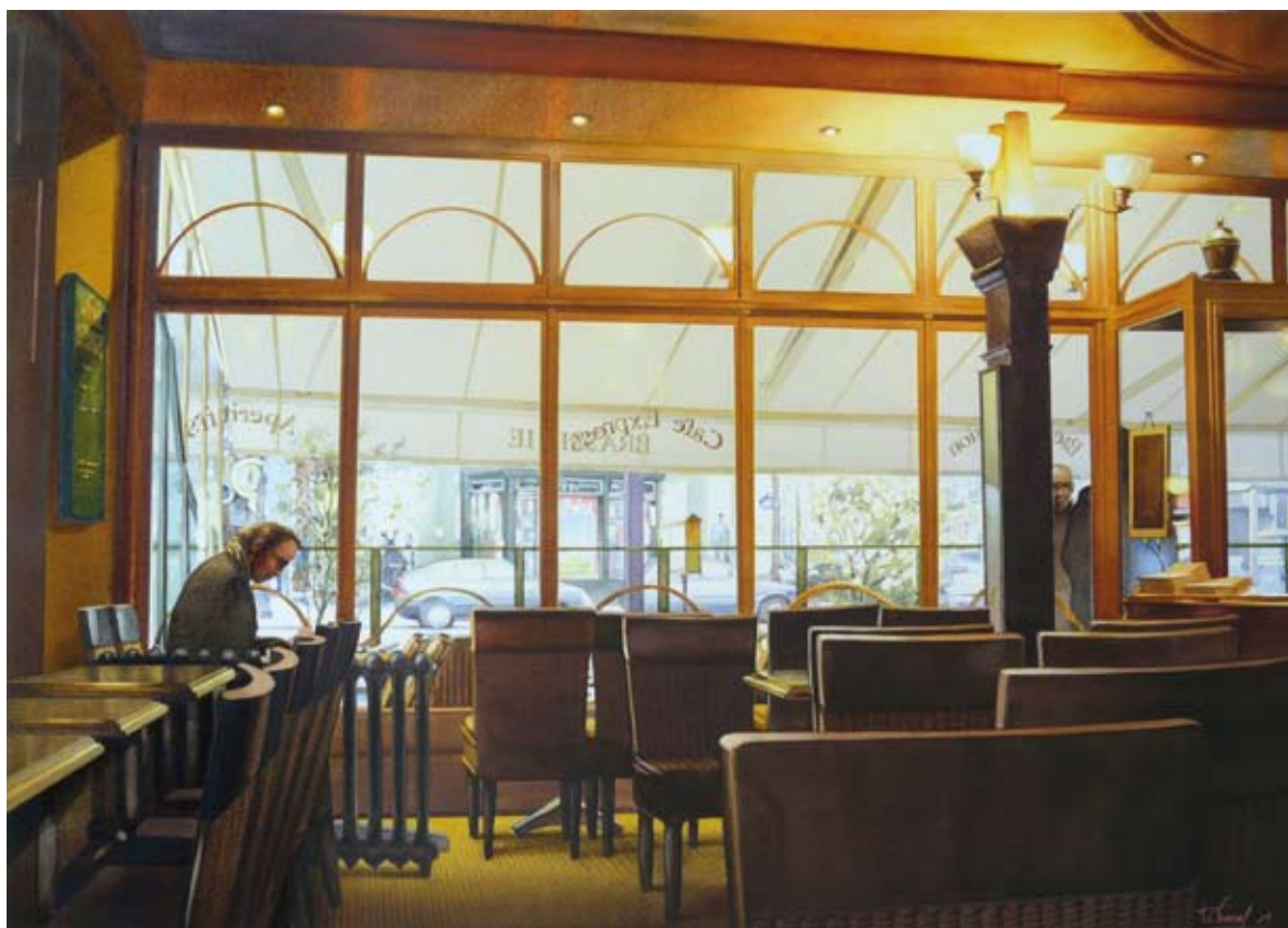
Un café, quatre personnages..., aquarelle, 75 x 55 cm, 2009.

“Paris... Plus que la capitale, c'est la lumière le sujet”