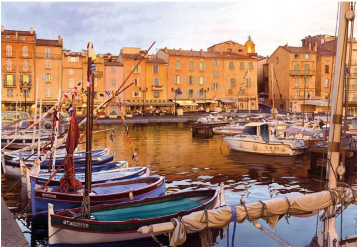
Le Port de Saint Tropez, Aquarelle, 93 x 65 cm, 2010.

“Rien n’est jamais acquis à l’aquarelle.”