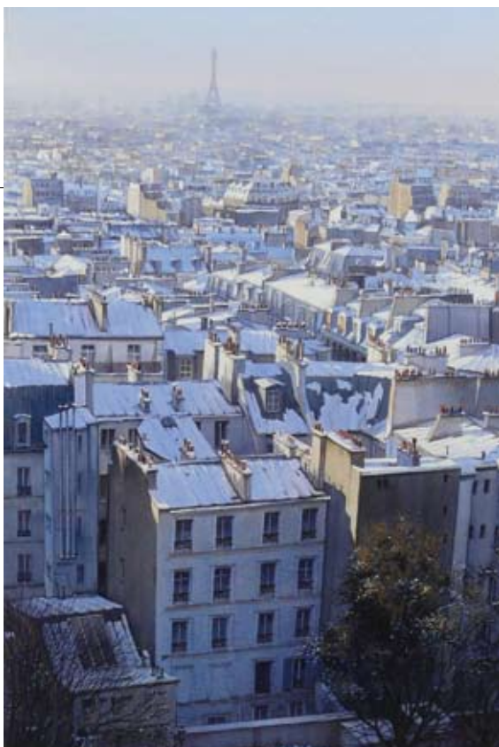
Les Toits de Montmartre sous la neige, Aquarelle, 33 x 82 cm, 2011 (détail).

“Rien n’est jamais acquis à l’aquarelle.”